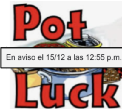
En aviso el 15/12 a las 12:55 p.m.