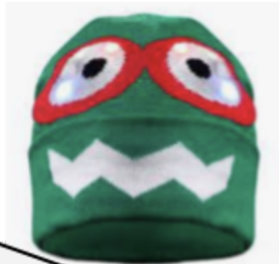
Suéteres, calcetines y gorros feos ... ¡¡¡Día del partido !!!