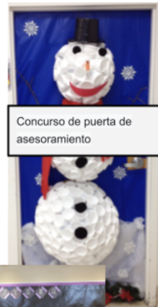
Concurso de puerta de asesoramiento